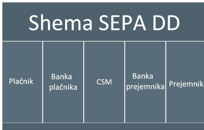
Slika 1: Udeleženci v sistemu SDD

ComTradeova rešitev za SEPA DD predstavlja celotno rešitev za banke, saj nudi: